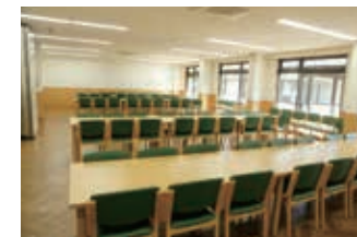
洋室はパーテーションを開放して部屋続きで利用可能です。